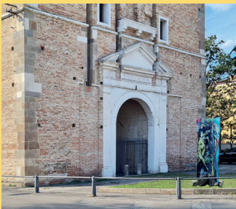
PORTA LIVIANA "TRASLITTERAZIONE" Installazione di DANIELA ANTONELLO e MARIO BARBIERATO