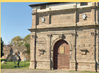
PORTA SAN GIOVANNI "LA BALLERINA" Installazione di LUCA PEGORARO