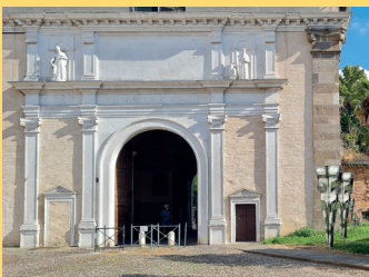
PORTA SANTA CROCE "OSSESSIONI" Installazione di CARLO BETTIN

La manifestazione, giunta alla dodicesima edizione, è ideata e organizzata dal Teatro Laterale in collaborazione con il Comitato Mura, ed ha come obiettivo quello di creare interazioni tra i monumenti e i luoghi storici cittadini e l'arte contemporanea.