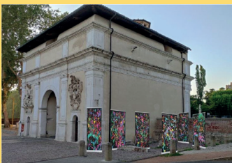
PORTA PORTELLO "UNIVERSAL INDICTMENTS PORTALS SERIES" Installazione di VALENTINA BRAGHETTO