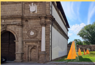
PORTA SAVONAROLA "SACERDOTI DI ANTICHI RITI" Installazione di CARLA RIGATO